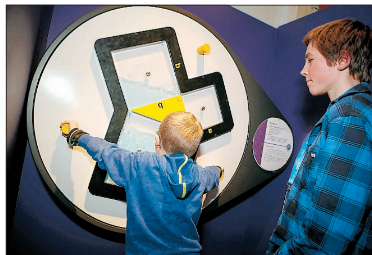
TESTER: I Vitensenterets utstilling kan barna selv teste hvordan fysiske lover virker.